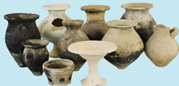
弥生時代中期(IV様式)の土器