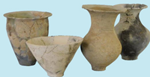
弥生時代前期の遠賀川式土器