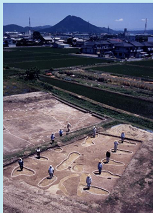
伊勢遺跡大型建物検出風景

さらに、この方形区画を中心に直径約220mの軌跡上でも柱根が残存していたSB-4をはじめ、7棟の独立棟持ち柱建物が検出されています。このように、12棟の大型建物の規模や構造は多様で、それぞれの建物が機能を分担して、特別な空間を構成したと推察されます。