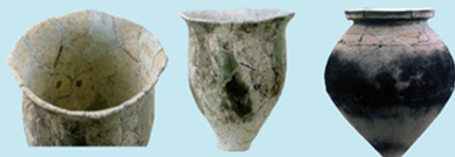
受口状口縁誕生の祖形・波状口縁甕と受口状口縁甕