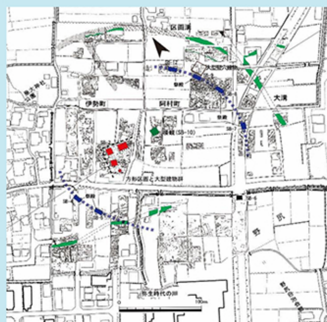
伊勢遺跡大型建物位置図