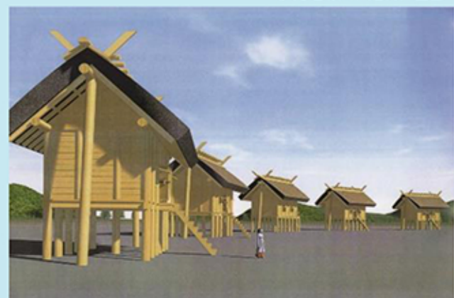
伊勢遺跡大型建物想像図（小谷正澄氏作成）

伊勢遺跡に大型建物群が建ち並び威容を誇っていた2世紀半ばから後半にかけての日本について、倭国は大いに乱れていた「倭国大乱」、争乱の末1人の少女が王となった「卑弥呼共立」、3世紀の日本に30余りの「国」があったと、中国の史書である「魏志倭人伝」は伝えています。